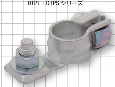
ボルトタイプ DTPL・DTPSシリーズ